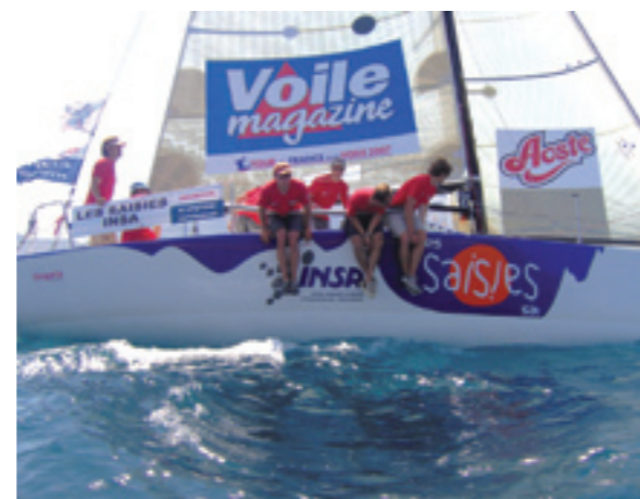
Le bateau Les Saisies Insa, vainqueur du Tour de France à la Voile 2007 dans la catégorie étudiants.